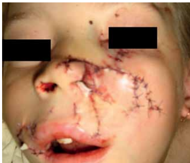
Рис. 6. Тот же ребенок. Выполнена ПХО ран лица, одномоментная пластика с закрытием истинного дефекта тканей лица слева собственными тканями.