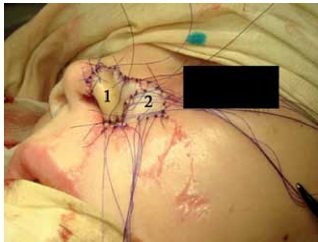
Рис. 11. Тот же ребенок. Выполнена свободная кожная пластика, операция Сулова. 1 - сформированное из участка ушной раковины крыло носа. 2 - дефект кожи замещен кожным трансплантатом.

Полученные нами результаты не противоречили сведениям литературы, однако имели ряд существенных отличий. Данные, представленные в опублико-