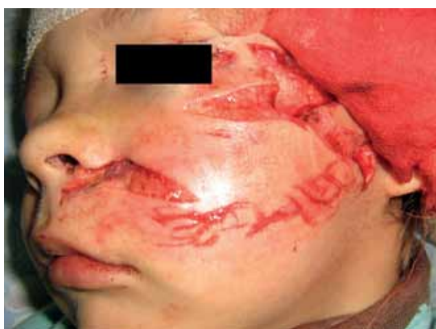
Рис. 1. Обширные укушенные раны лица у ребенка Ч., 4л.

* - отличия между выборками достоверны при p < 0,05