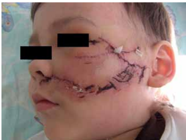
Рис. 3. Тот же больной. Флегмона лица.