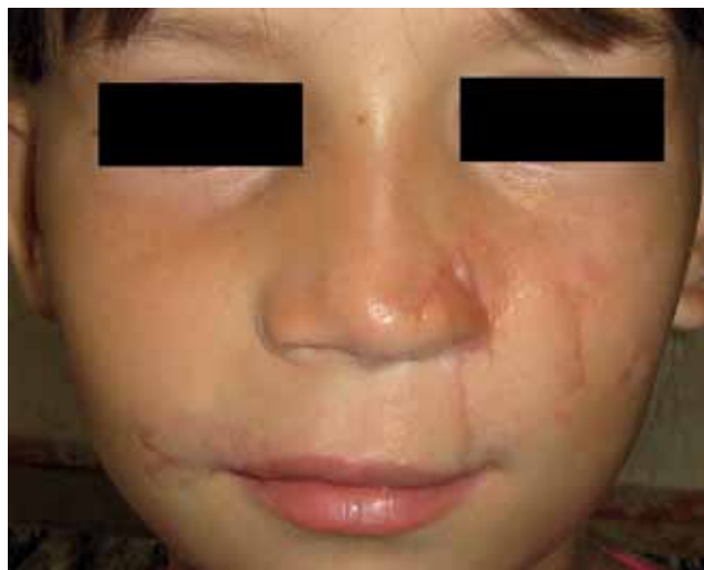
Рис. 12. Тот же ребенок. Выздоровление.

ванных к настоящему времени работах, включали очень широкий диапазон анизотермии, которую считают клинически значимой и имеющей прогностическое значение (0,7–8°C). В хирургии большинство осложнений, прогнозируемых с помощью термографии, целесообразно разделить на ишемические и гнойно-воспалительные. Волошин В.Н. и соавт. отождествляли хороший клинический результат с повышением местной температуры на 2°C [4]. Анизотермию между пальцами стопы и голенью пораженной конечности в 3-5°C рассматривали как признак нарушений кровообращения [4]. Однако авторы измеряли глубинную температуру. Последняя не может быть маркером той или иной патологии мягких тканей лица, толщина которых у детей минимальна. Кроме того, в названной работе не была определена достоверность результатов термометрии [4]. Другие клиницисты также ассоциировали определенные значения локальной гипотермии с утратой жизнеспособности тканями [3, 10]. В качестве критического значения в герниологической практике признавали \Delta t_0 > 1,5^\circ\text{C} [10]. В работах травматоло-