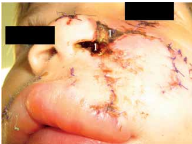
Рис. 8. Тот же ребенок. 8 сут после ПХО ран лица. 1 - зона некроза мягких тканей лица.