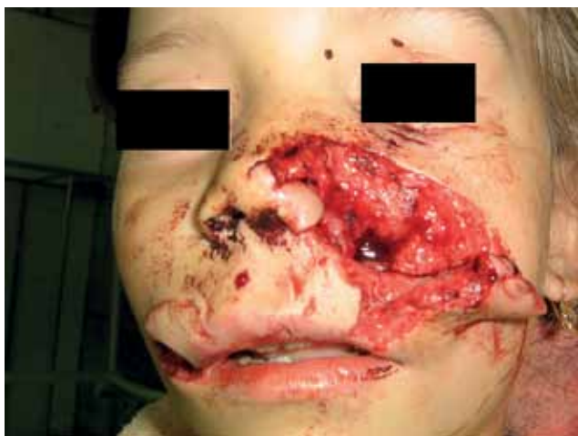
Рис. 5. Обширные укушенные раны лица у ребенка Д., 7л.